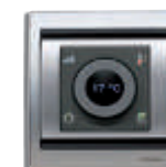
Termóstato com Ecrã