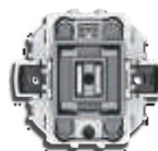
Acoplador 2 canais