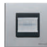
Detetor de Movimento