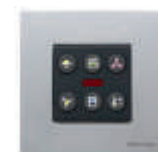
3/6 canais + IR