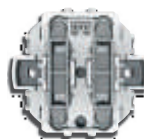
Acoplador 1 canal