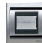
Detetor de Movimento