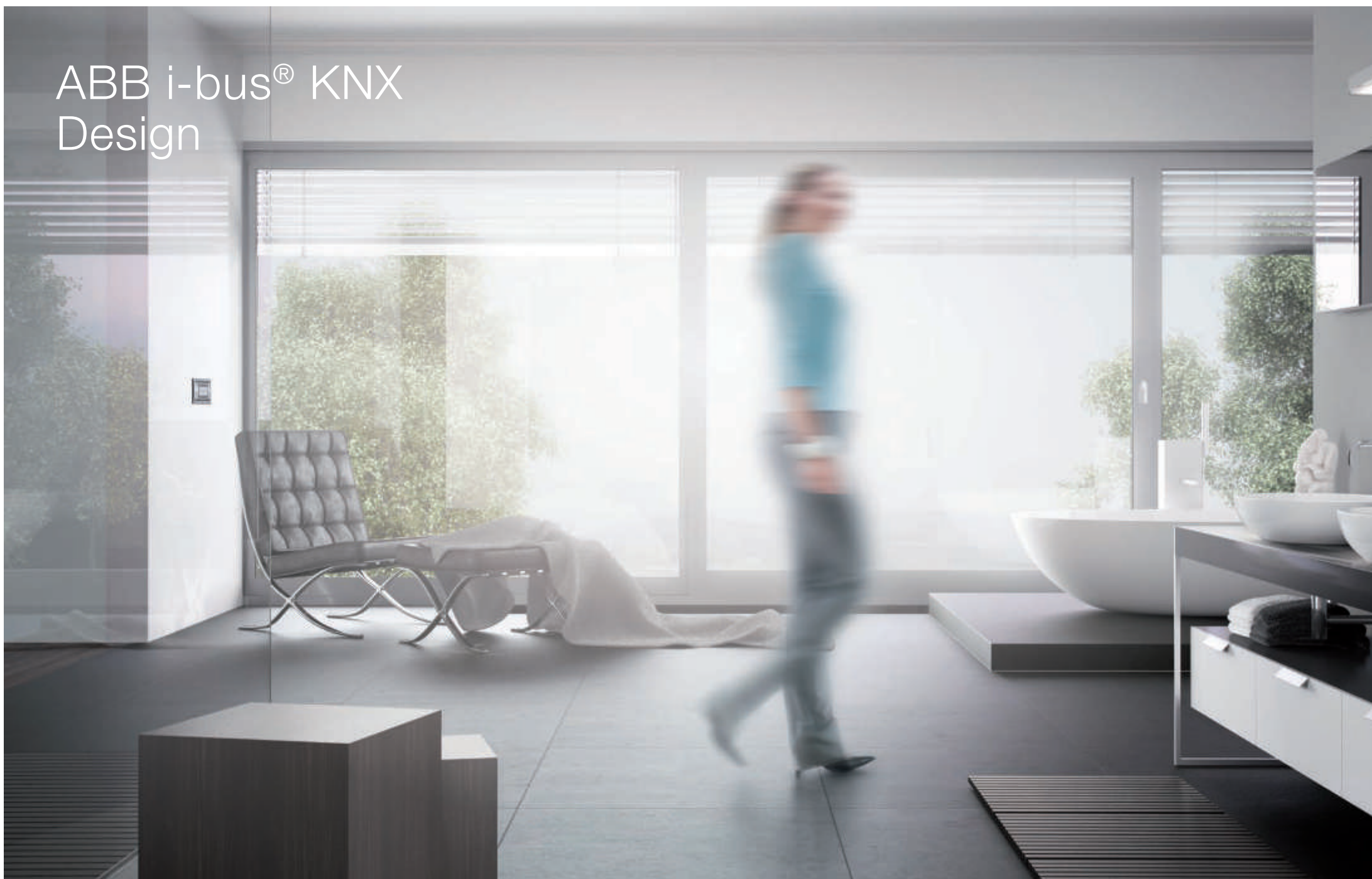
ABB i-bus® KNX Design