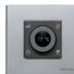
Termóstato com Ecrã