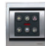
3/6 canais + IR